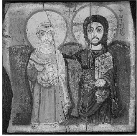
Ikone der Freundschaft, Taizé

Liebe Jugendliche und alle Interessierten!